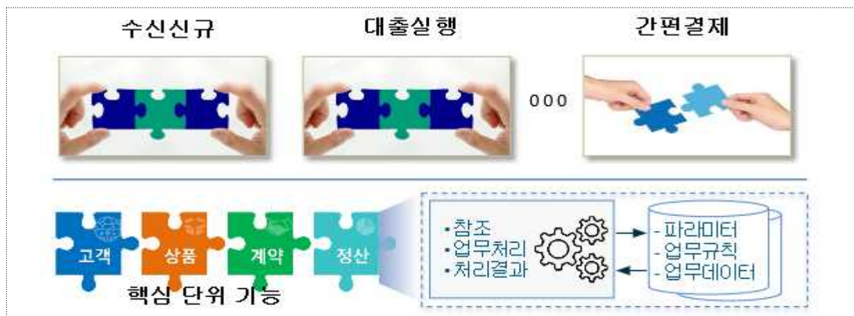
<모듈형 新코어뱅킹 구조>