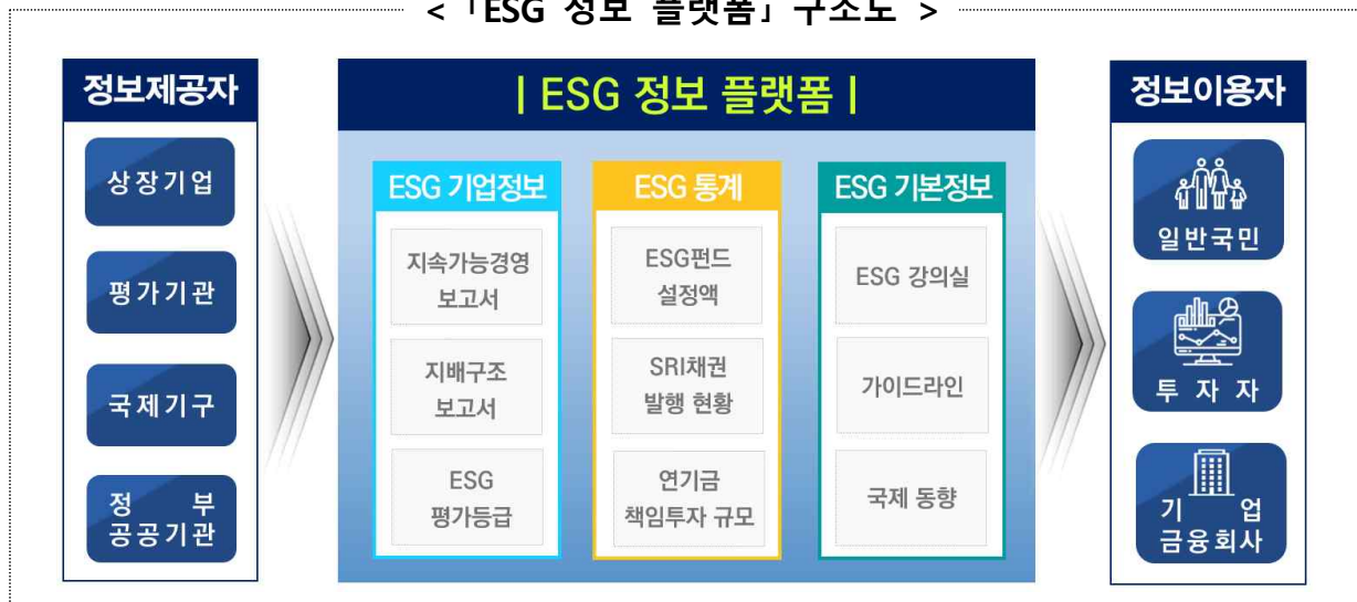
< 「ESG 정보 플랫폼」 구조도 >