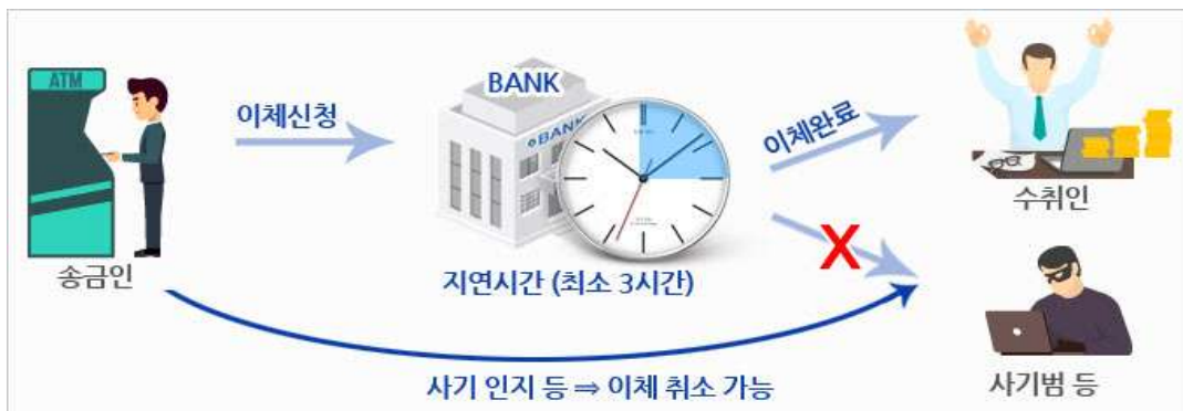
<지연이체서비스 처리 흐름>