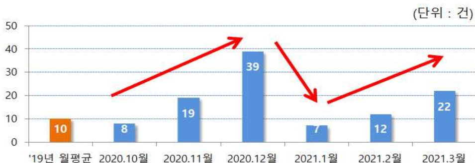
<불공정거래 의심 상장社 신규 추이>

- 매월 신규로 추가되는 상장社수는 '20.12월 39개社로 정점을 기록한 이후 감소하다가 최근 다시 증가하는 추세