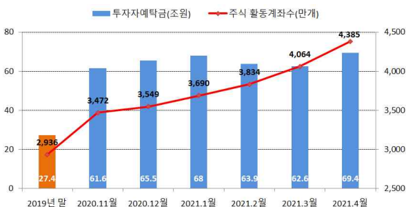
<투자자예탁금 및 주식 활동계좌수>

* 27.4조('19년말)→65.5조('20.12월말)→69.9조('21.4.27)