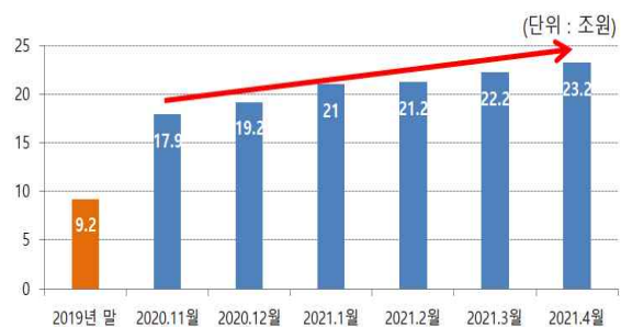
<신용거래융자 잔고 추이>

* 9.2조('19년말)→19.2조('20.12월말)→23.4조('21.4.27)