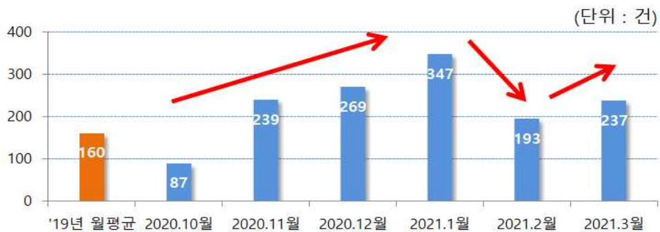
<시장경보조치 발동 건수>

- '21.1월 347건 이후 감소하였으나, 코로나19 이전 수준을 상회